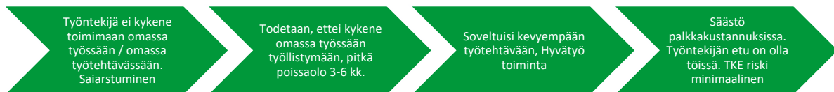
Kuva.1 Arkikuntoutukseen sopivan työntekijän tunnistamisen prosessi

Työntekijän osalta hankkeen tavoitteena on mm. lyhentää sairauslomia tai mahdollisesti siirtää tai jopa estää ennen aikainen eläköityminen. Arkikuntoutuksen pilotin kautta on tarkoitus osoittaa toiminnan kustannusvaikuttavuutta, jota voidaan jatkossa käyttää perusteena toiminnan vakiinnuttamiselle hyvinvointialueen omalla rahoituksella.