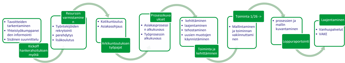
Kuva.3 Hankkeen (pilotoinnin) eteneminen

Jatkuvat ohjausryhmän, seurannan ja yhteistyökumppaneiden kanssa pidettävät palaverit.